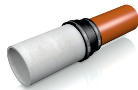
Zweites Spitzende in die Adapterkupplung schieben und Schlösser anziehen.