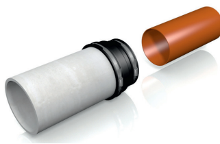
Adapterkupplung über ein Spitzende schieben.