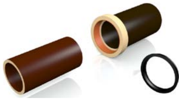
Passring auf Spitzende aufziehen.