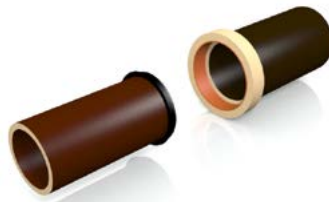
Gleitmittel in Muffe und auf Dichtung auftragen.