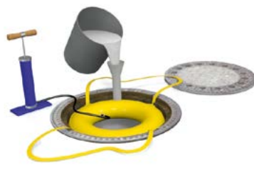
Schlauchschalung positionieren und aufpumpen. Mörtel in Gießrohr einfüllen.