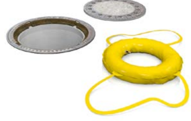
Schlauchschalung nach Aushärtung entnehmen.